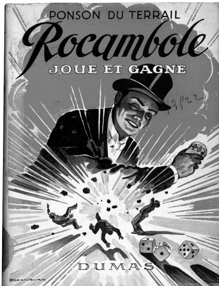
Ponson du Terrail, Rocamboles joue et gagne , Dumas, 1949