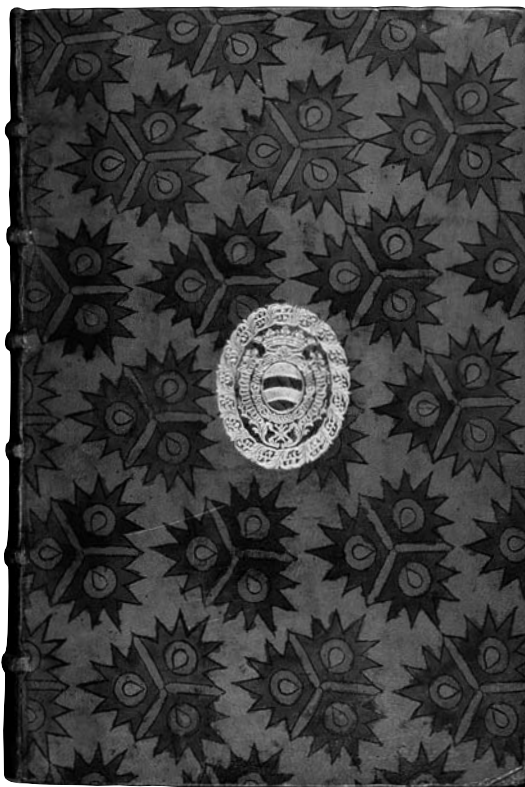
2. Hérodote, [Grec] Historia sive Historiarum libri IX , Genève, 1570, in-fol.

La Réserve des livres rares conserve une troisième reliure inédite en maroquin imprimé, de couleur citron. Son décor repose sur la répétition d'un bois dont le motif floral presque géométrique dans sa découpe des trois pétales dentelés au cœur partiellement rougi, grossièrement teintés en vert et olive, est disposé par bandes horizontales (ill. 2). Elle recouvre un texte qui figure aussi dans la bibliothèque des Dupuy, une édition grecque d'Hérodote, mais il ne s'agit pas ici de leur exemplaire, qu'ils tenaient, déjà relié en vélin, de leur père Claude 16 . Ce premier critère discriminatoire est conforté du fait que ce volume comporte un second texte grec 17 non cité dans le catalogue des Dupuy et qu'il n'est pas entré à la Bibliothèque royale au XVII e siècle, comme l'attestent sur ses plats la présence des armes du comte d'Hoym 18 (1694-1736) et une estampille du XIX e siècle sur sa page de titre 19 . Cette pièce, dont on distingue étrangement au dos les traces d'un décor filigrané inachevé, serait plutôt à rapprocher de la bibliothèque de J.-A. de Thou, qui possédait d'autres volumes reliés d'un maroquin identique 20 .