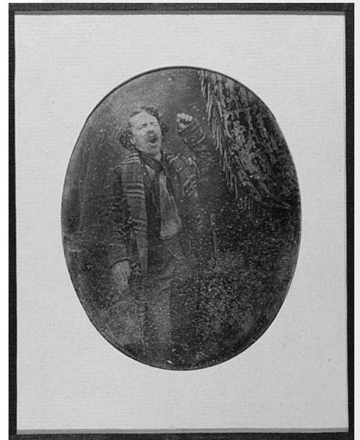
Portrait d'homme bâillant, brillant ou chantant

À sa fenêtre sans doute ? Une de 1851 fermée sur l'hiver. L'écharpe de laine en témoigne, et l'air enrhumé du visage large dont le nez remonte, prêt à éternuer. Une ombre de moustache parfume à peine les lèvres. Le négligé habile des habits semble vouloir indiquer une pseudo-condition artiste qu'accentue le foulard. Il y a de la palette dans cette main grasse pendante alors que l'autre moins adulte dressée comme un poing d'enfant exprime la candeur du sommeil d'où l'on sort. Les yeux plissés à la tatare fixent encore les steppes nomades du songe, mais la chevelure plus éveillée sort à l'instant des soins du peigne. Pose-t-il ? On ne peut parler à son égard d'une image volée, prise à son insu. Il sait manifestement qu'on le représente. Il se représente donc. La satisfaction l'emplit de la tête aux pieds. Nous nargue-t-il en se laissant éterniser dans une attitude si familière ? Que signifie ce bâillement qui l'étire jusqu'au tréfonds de son être ? L'ennui de la vie, du tout et du rien, l'ennui d'être vivant ? d'avoir à accomplir son activité d'homme, d'avoir bientôt à descendre, monter des escaliers, à se propager dans ses divers rôles ? Est-